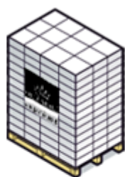
pedana / pallet