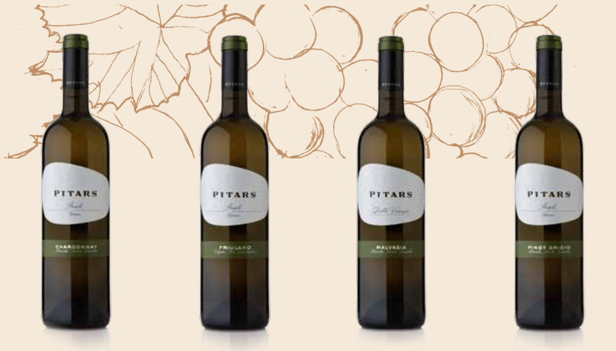
CHARDONNAY DOC Friuli Grave Braida Santa Cecilia

Caratteristiche del vino Giallo paglierino. Fine, elegante, nobile e snello di corpo. Ha freschi profumi di mela Golden, ananas e mandorla bianca, con vibranti accenti d'agrumi. Morbido e cremoso, piacevolmente bilanciato da freschezza e sapidità.