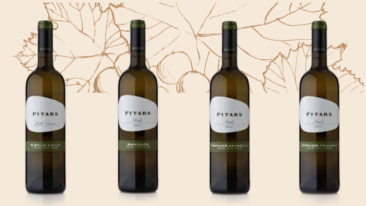
RIBOLLA GIALLA IGT Delle Venezie Braida Santa Cecilia

Caratteristiche del vino Fragranti profumi floreali e fruttati che richiamano la susina e la pesca. Sapore fresco e asciutto, elegantemente citrino, persistente sulle note agrumate e dal finale lievemente aromatico.